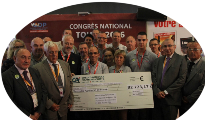
Remise officielle du chèque à l'ODP par une partie des bénévoles des concerts en présence du Directeur de la DGSCGC

Chaque UDSP vient y prendre les infos et les tendances qui lui permettront durant l'année de diffuser, communiquer et produire du Vivre ensemble de manière homogène sur tout le territoire national.