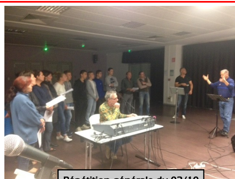
Répétition générale du 02/10

Nous comptons sur chaque amicale pour diffuser au maximum l'information.